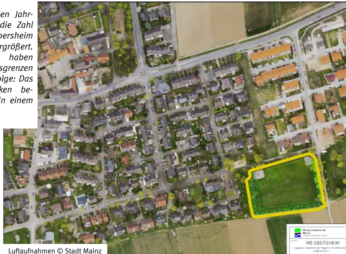
Luftaufnahmen © Stadt Mainz

In den vergangenen Jahrzehnten hat sich die Zahl der Einwohner in Ebersheim kontinuierlich vergrößert. Dementsprechend haben sich auch die Ortsgrenzen ausgedehnt. Die Folge: Das Regenrückhaltebecken befindet sich heute in einem Wohngebiet.